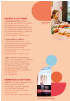
Sem handicap Antony 2025-2.png 309K