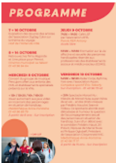
Sem handicap Antony 2025-1.png 268K