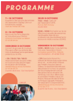
Sem handicap Antony 2025-1.png 268K