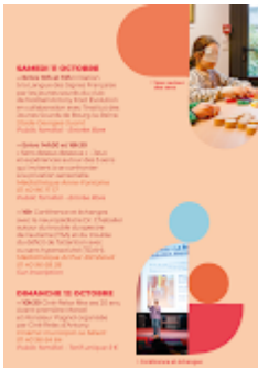
Sem handicap Antony 2025-2.png 309K